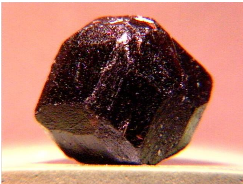
Η λυδία λίθος, άλλως «βάσανος»

Με τον όρο «βασανιστήρια» δηλώνονται όλες οι πράξεις βίας ή φυσικού καταναγκασμού στο σώμα του κατηγορουμένου για να αποσπαστεί η ομολογία ενός εγκλήματος ή στο σώμα ενός μάρτυρα για να εξασφαλιστεί μια αληθοφανής κατάθεση. Η ετυμολογική προέλευση των εντοπίζεται στη ελληνική λέξη «βάσανος», που σήμαινε την λυδία λίθο (σκληρό σκουρόχρωμο ορυκτό) με την οποία δοκιμαζόταν στην αρχαιότητα η γνησιότητα του χρυσού.