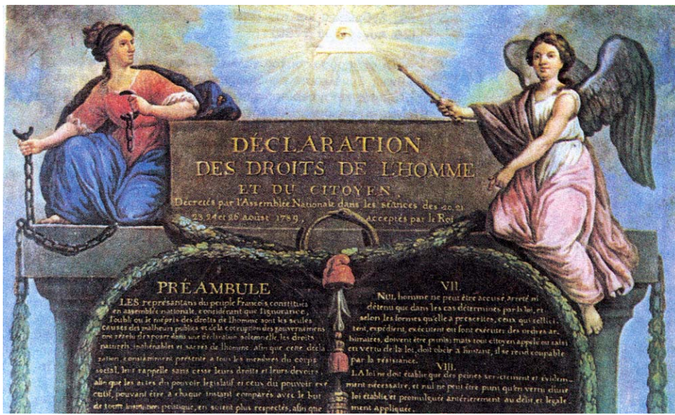
Εικόνα Σφάλμα! Άγνωστη παράμετρος αλλαγής.: Η Διακήρυξη των δικαιωμάτων του ανθρώπου και του πολίτη